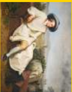
GOETHE NELLA CAMPANIA ROMANA (1787) olio su tela di Wilhelm Tischbein, Stadtmuseum Frankfurt am Main.

Uno dei più famosi resoconti del Grand Tour è l' ITALIENISCHE REISE di Goethe, scritto nel 1828, circa quarant'anni dopo il viaggio reale, compiuto nel 1786.