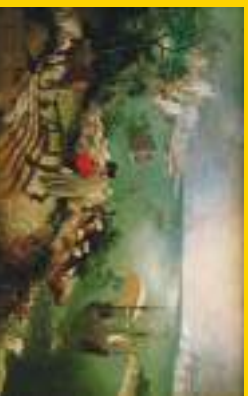
COULTA DI CASO (1558) olio su tela di Pieter Bruegel il Vecchio, Museo royal des Beaux-arts de Belgique, Bruxelles.

I pittori fiamminghi compiono viaggi in Italia: nel 1400, invitati dalle corti reali e il secolo dopo, attratti dall'arte del Rinascimento, tra questi, Pieter Paul Rubens, Antoon van Dyck, Pieter Bruegel.