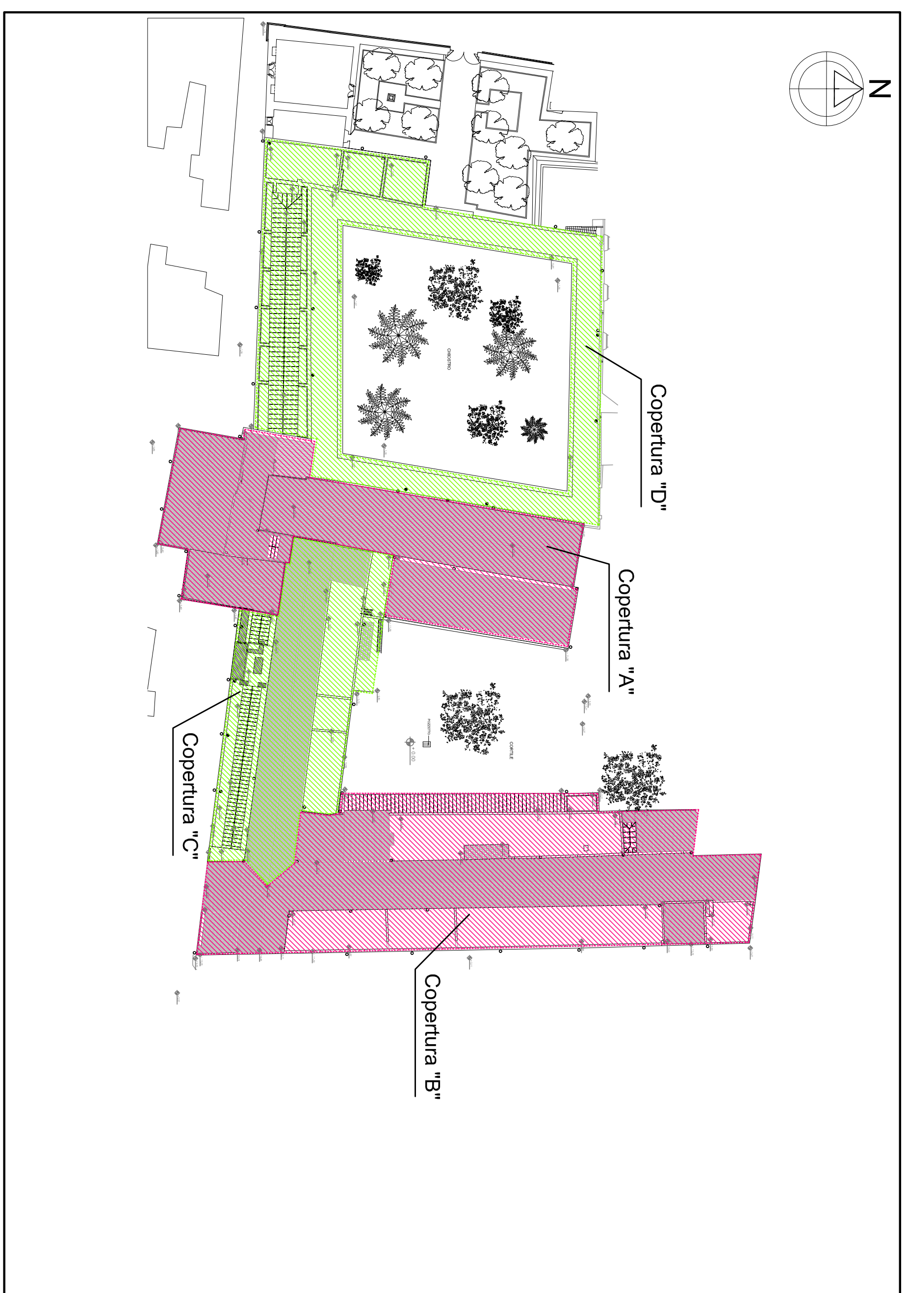
KEY PLAN - PIANTA PIANO COPERTURE SCALA 1:500