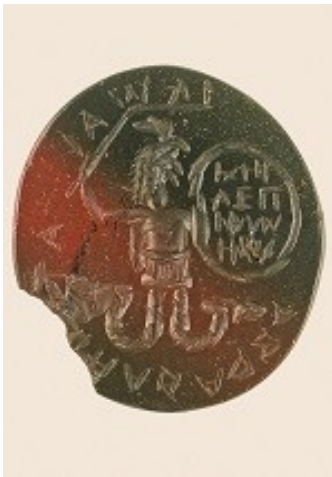
Gemma magica (II-III secolo d.C.)

I materiali per l'attività laboratoriale dovranno essere portati dagli alunni: materiale per scrivere, telefonini ed eventualmente tablet.