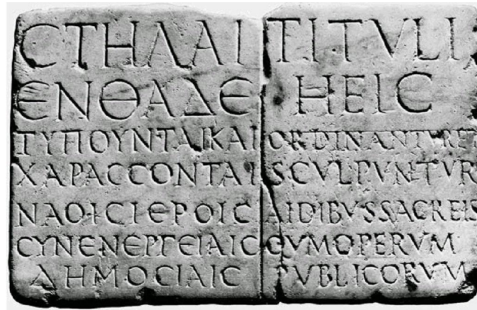
Insegna di scalpellino (II secolo d.C.)