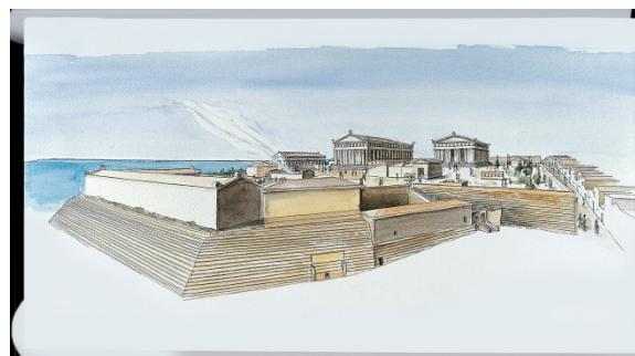
Acropoli di Selinunte: disegno ricostruttivo