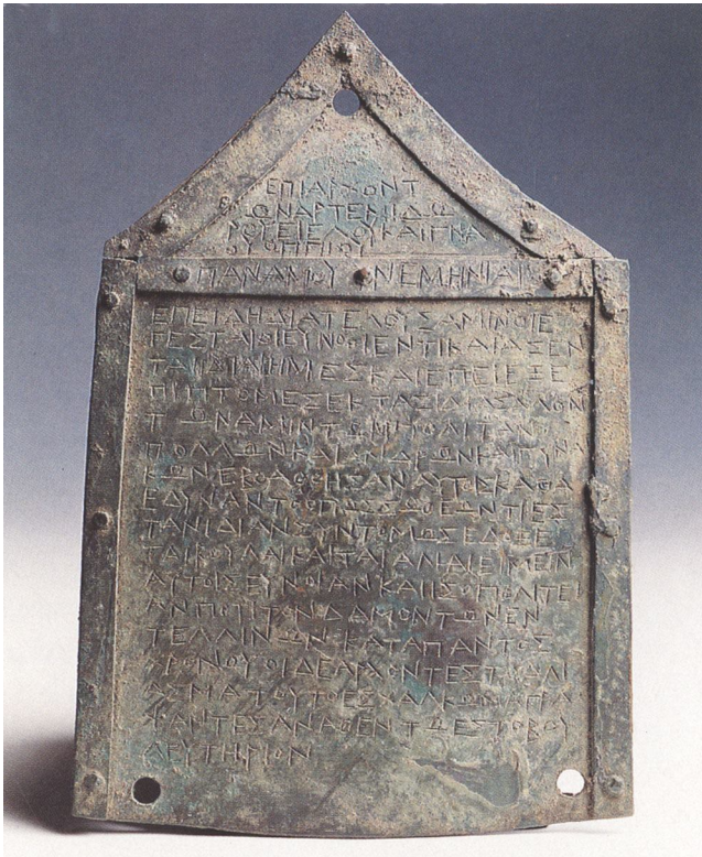
Decreto di Entella (III secolo a.C.)