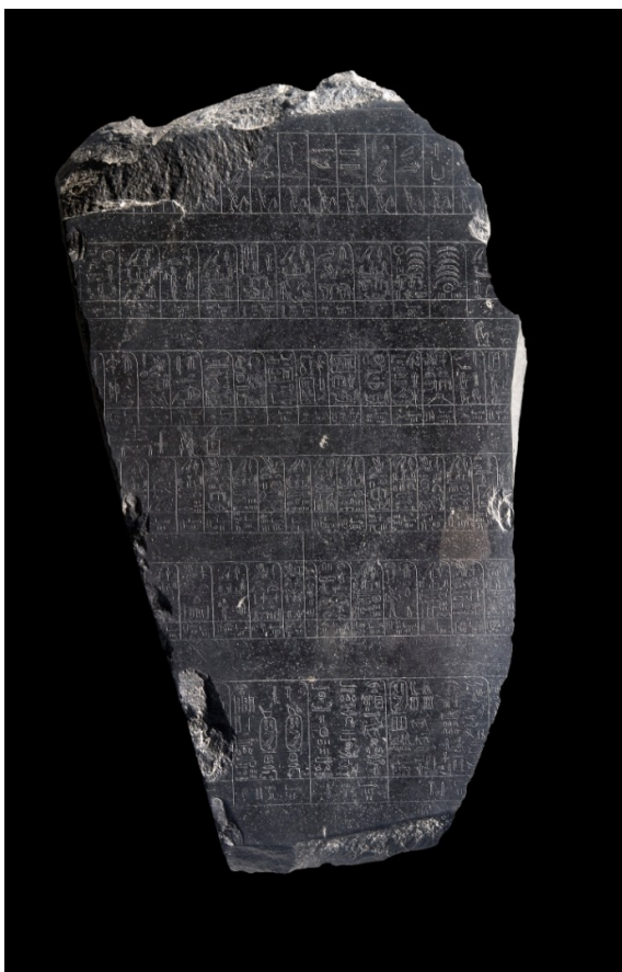
Pietra di Palermo (II millennio a.C.)

Si prevedono percorsi differenziati in modo da calibrarli secondo le diverse fasce d'età e l'indirizzo scolastico.