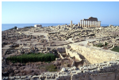
Acropoli di Selinunte

L'offerta formativa sarà modulata in tre diversi livelli adeguati alle conoscenze degli allievi di ciascun grado scolastico, seguendo il percorso espositivo nelle sale dedicate all'architettura di Selinunte. Dopo una premessa sulla storia della città e degli studi e la presentazione della pianta del sito, saranno trattati più specificamente gli argomenti relativi all'urbanistica e all'architettura templare attraverso l'illustrazione delle opere esposte, con particolare attenzione ai grandi templi dei principali santuari dell'acropoli e della collina orientale. Le diverse fasi costruttive dei monumenti saranno riferite al contesto storico-politico e socio-economico di pertinenza.