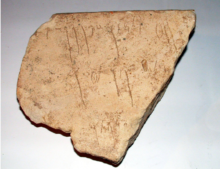
Alfabetario punico in pietra da Selinunte (IV secolo a.C)

I materiali per l'attività laboratoriale dovranno essere portati dagli alunni: carta, penna, matite, matite colorate, forbici a punta tonda.