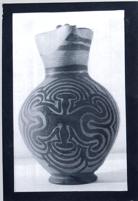
Vaso da Polizzello dell'Età del Ferro (XIV-XIII sec. a.C.)