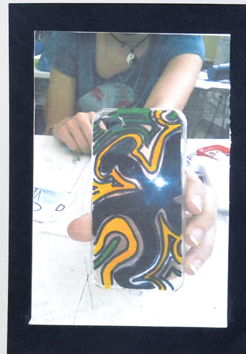
Realizzazione completa su cover trasparente per iPhone 4S. I materiali utilizzati sono: cover trasparente master carta, pennarello indelebile e colori acrilici. È stata acquistata una cover trasparente, sono stati esportati i lati con il master carta, è stata tracciata la sagoma prestabilita con un pennarello indelebile, è stata dipinta con gli acrilici.