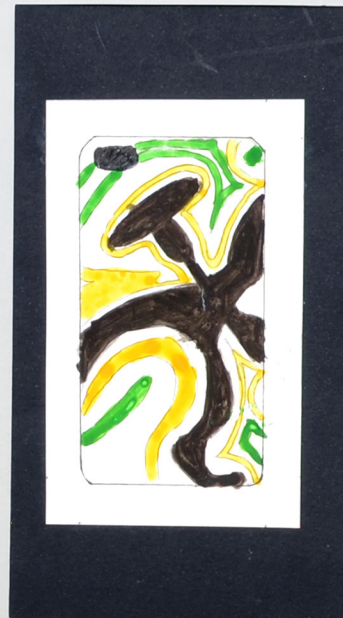
L'idea è stata presa dal vaso da Polizzello per la precisione della figura raffigurante un polpo.